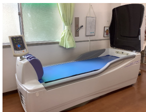
ウォーターベッド