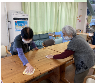
テーブル拭き練習